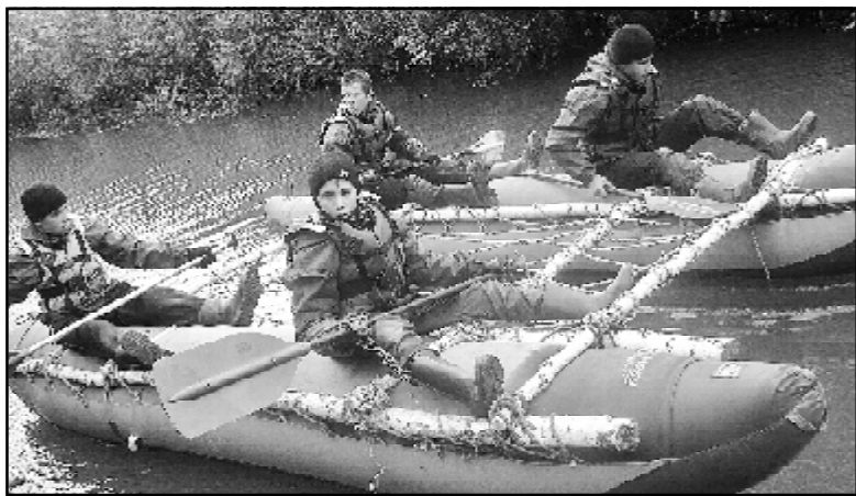
Состязания на самодельных катамаранах

стызаний нам очень понравился. Теперь мы сможем сами изготовить плавательное судно. И в этом соревновании мы победили: пришли к финишу первыми. А вообще результаты нашей командной борьбы такие: 1 место – в кроссе и силовом многоборье, 2 место – на туристической полосе, в спортивном ориентировании, 3 место – в спасательных работах с пострадавшим. Мы также участвовали в конкурсах газет, фотографий, организации быта, где были в итоге вторыми.