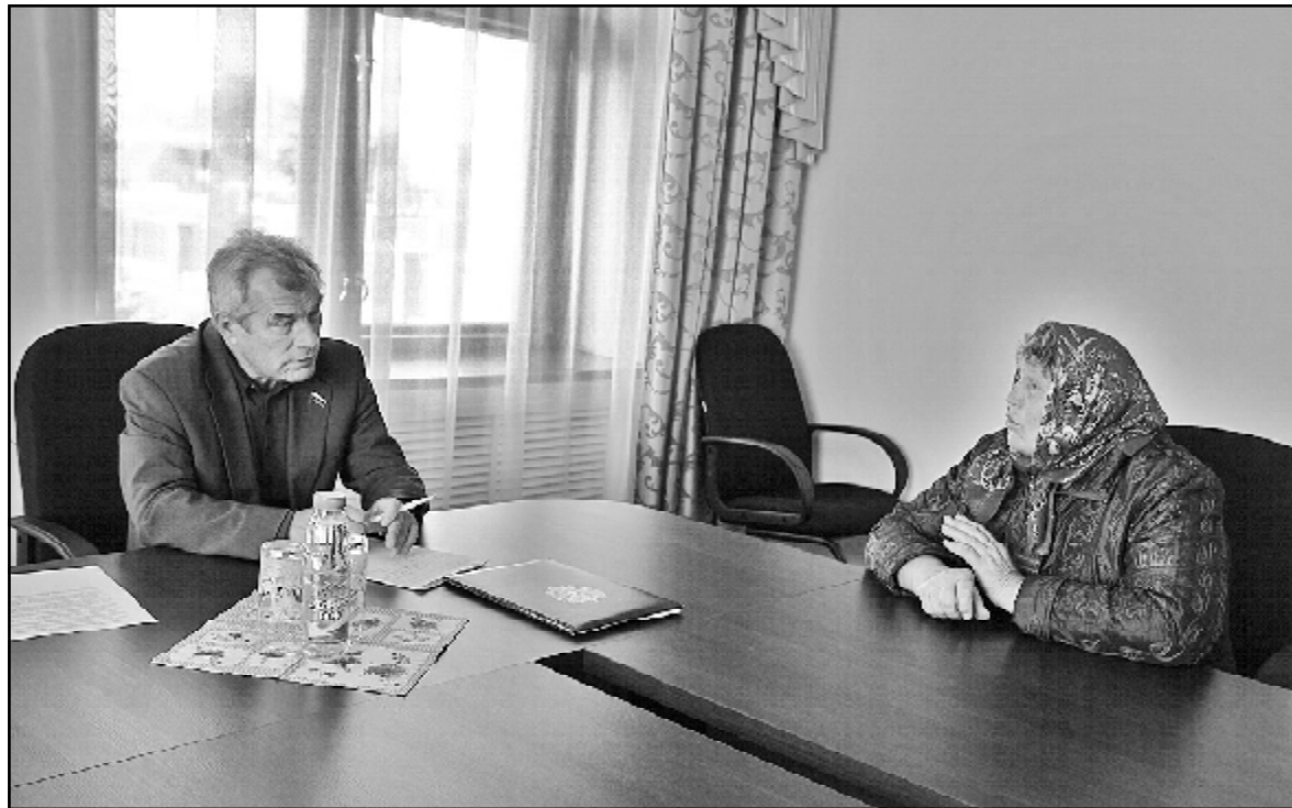
На приём к депутату – с наболевшим

Девятнадцатого сентября, во второй день поездки, депутат провёл приём граждан и пообщался с учащимися двух школ района.