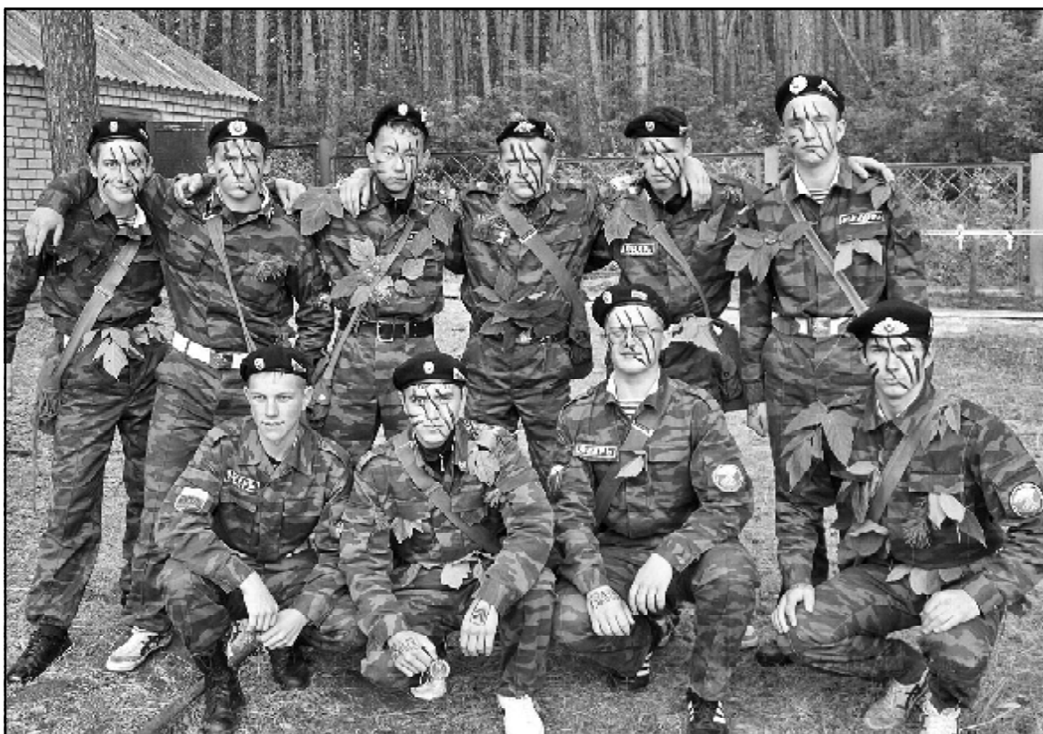
Храбрые мальчишки из класса «Русичи» Новоселёвской средней школы во время сборов в лагере «Ишимские ратники»