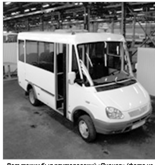
Вот таким был ялуторовский «Пионер»