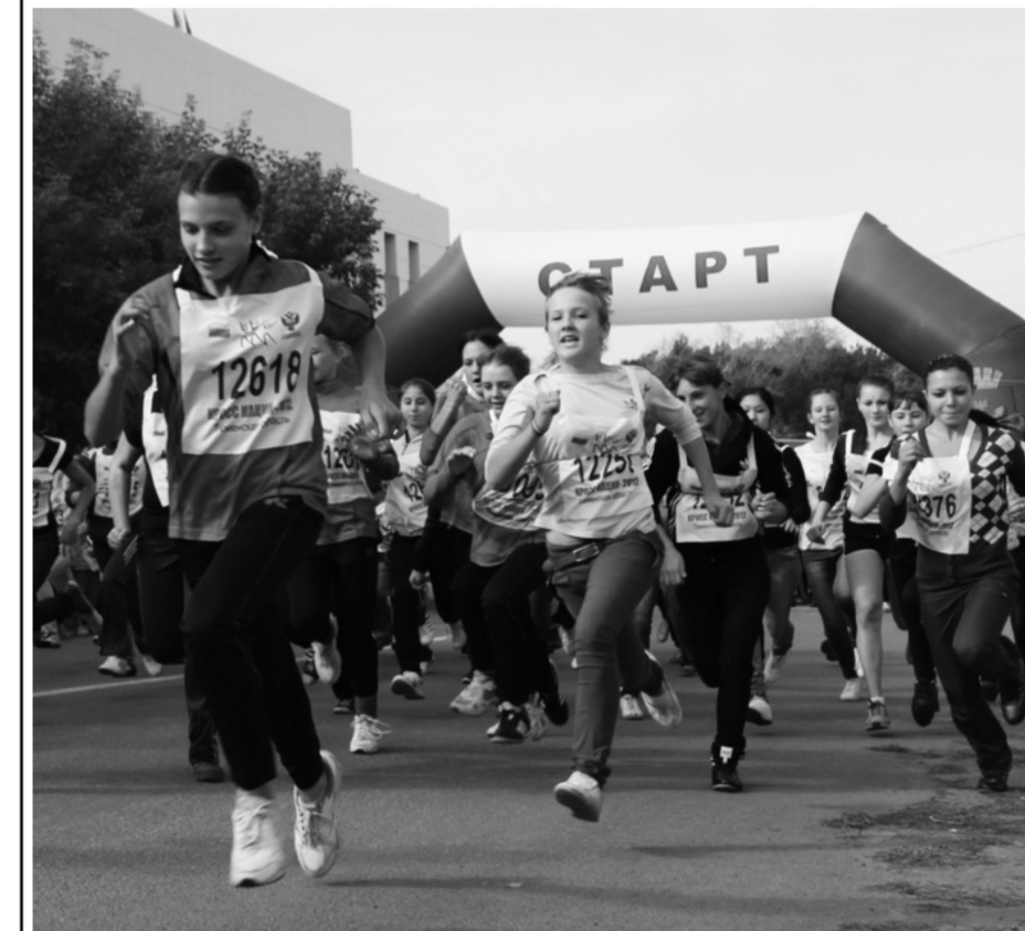
• Стартуют все!