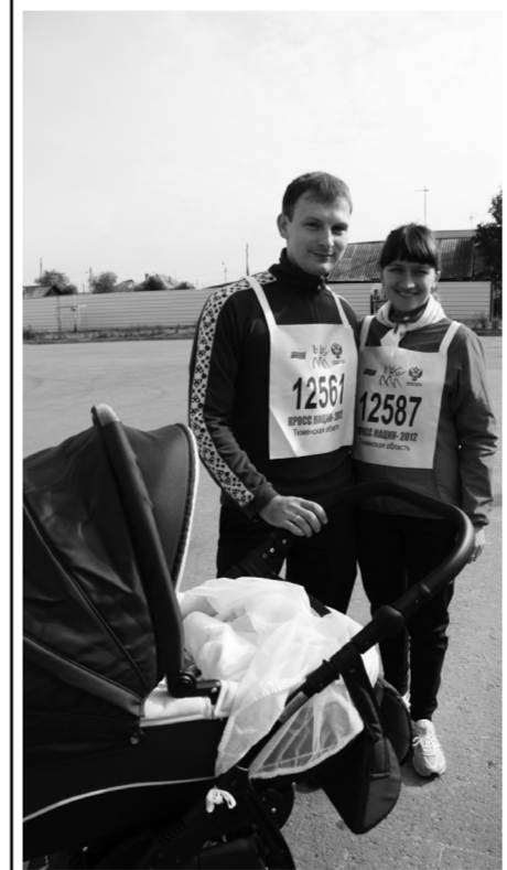
• За здоровьем – всей семьёй.