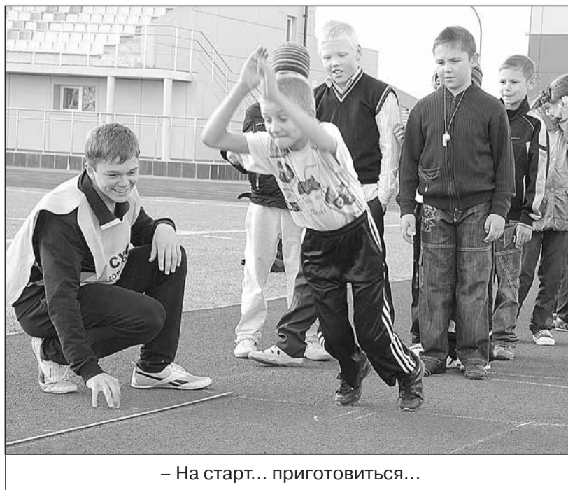
– На старт... приготовиться...