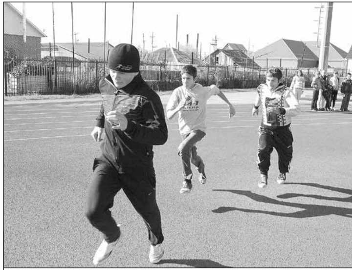
Не ждать, а догонять