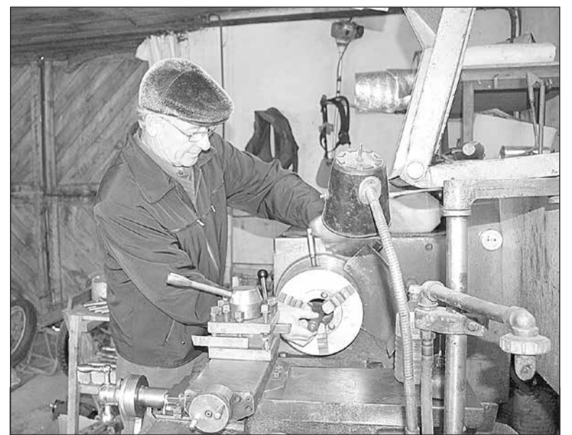
Глава хозяйства – в мастерской за станками