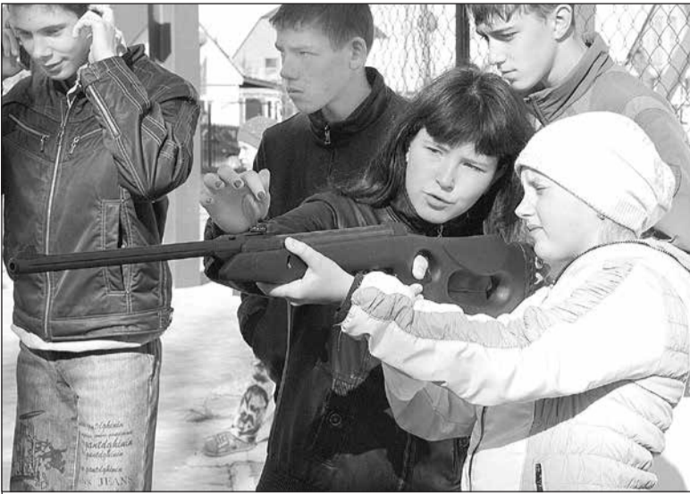
В стрельбе главное – точно прицеливаться