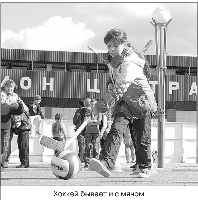
Хоккей бывает и с мячом