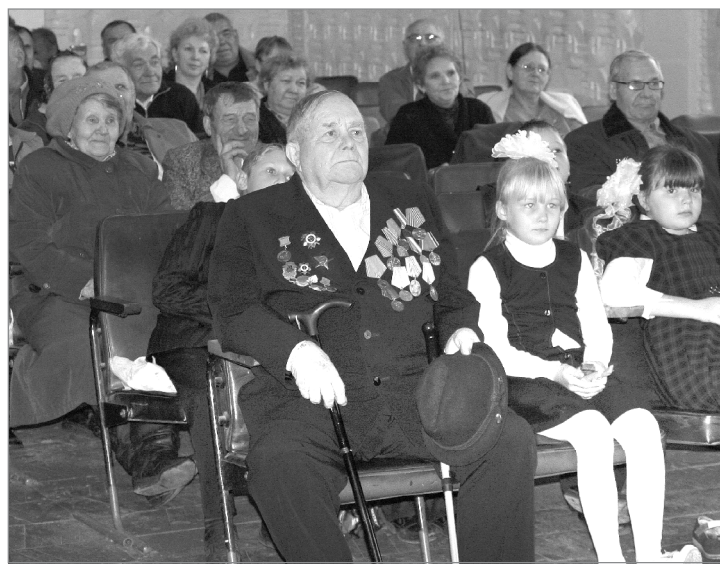
Ветераны «Автотранса» в зрительном зале вместе с подшефными школьниками