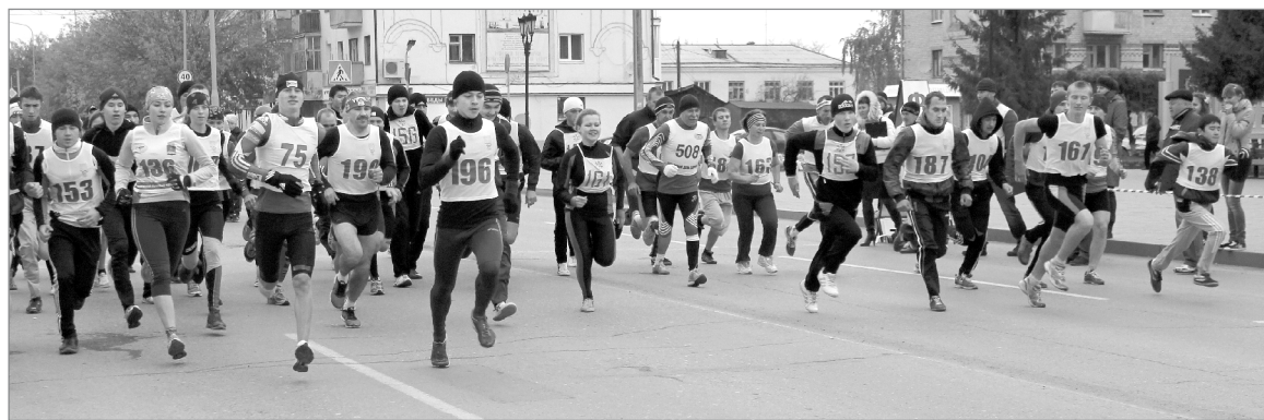
Главный старт на дистанции 5 километров

Почти полтысячи жителей Ялуторовска и района вышли на пробежку в рамках областного Дня здоровья. Самые быстрые по итогам соревнований получили дипло-