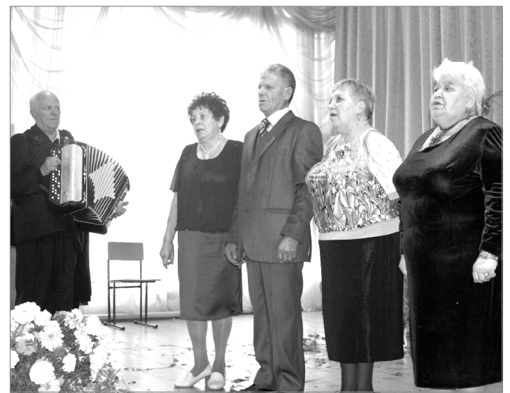
Хор ветеранов «Автотранса» хорошо спелся - в актовом зале репетиции идут каждый вечер