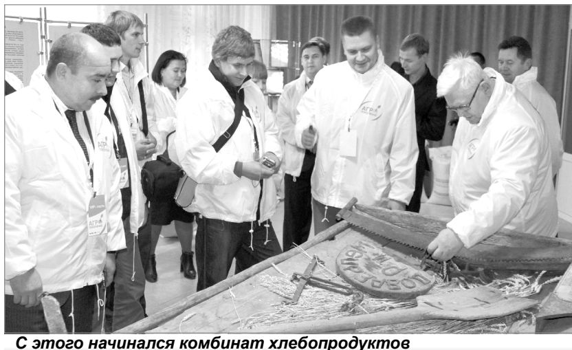
С этого начинался комбинат хлебопродуктов