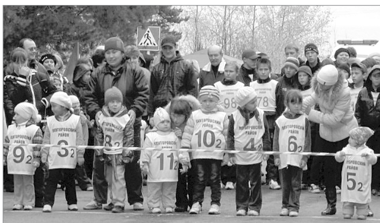
На старте - самые юные участники

праздничному настроению поклонников здорового образа жизни из всех сельских поселений района, прибывших на импрови-