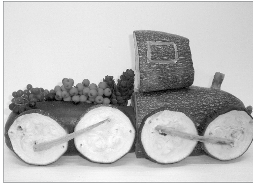
Весёлый паровозик из кабачка зовёт всех в путешествие по сказке «Природа и фантазия» (снимок слева); вот-вот взлетит в небо «кабачковый» вертолётчик