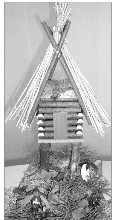
А кто живёт в этой избушке? Конечно же, Баба Яга