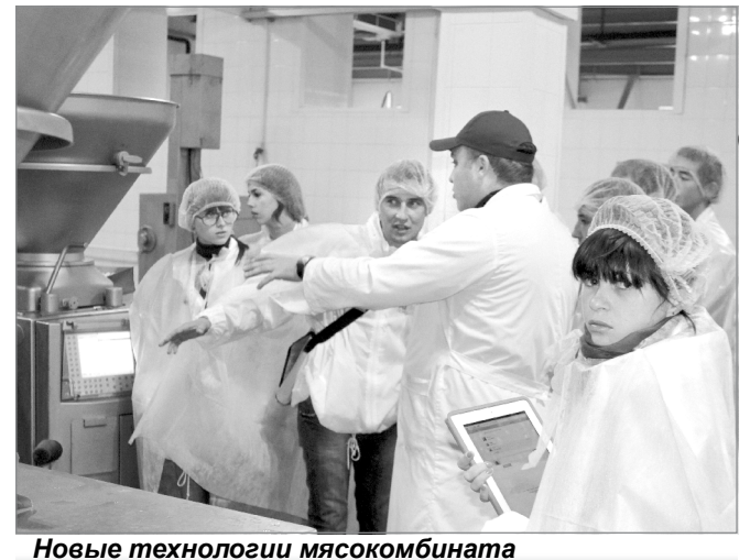
Новые технологии мясокомбината