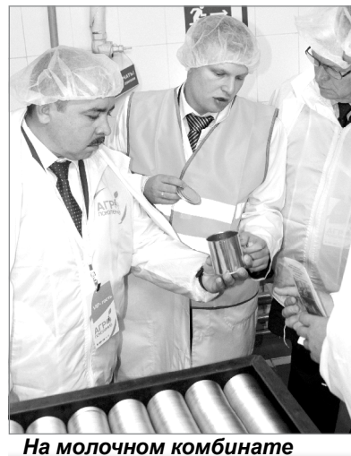
На молочном комбинате