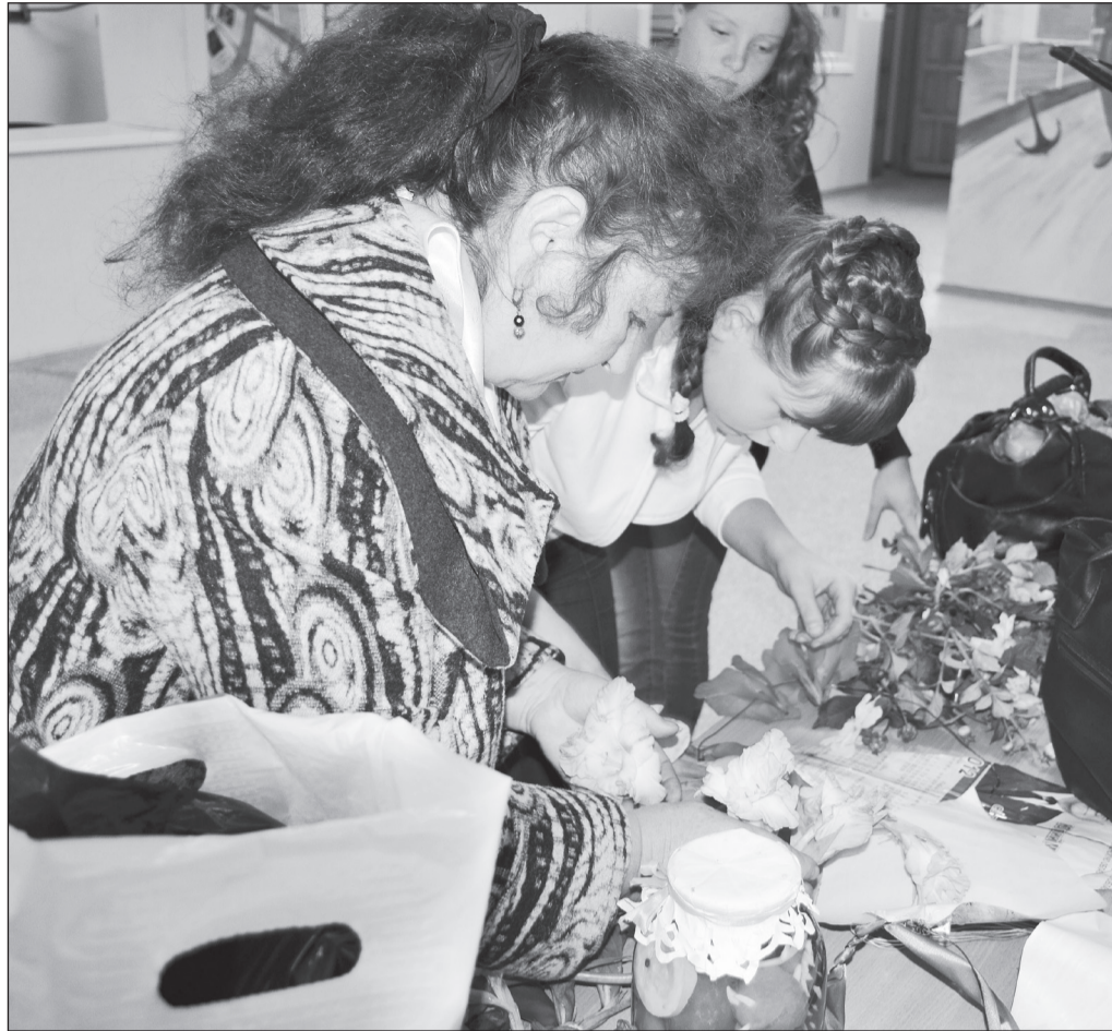
Пока ведущие объявляли лучших участников трудового лета, за кулисами готовили костюмы для дефиле.

Покорили сердца жюри выступления ребят в конкурсе нетрадиционной моды. Таких креативных моделей одежды ни разу не видела даже программа «Модный приговор» на первом канале. Все модели участники