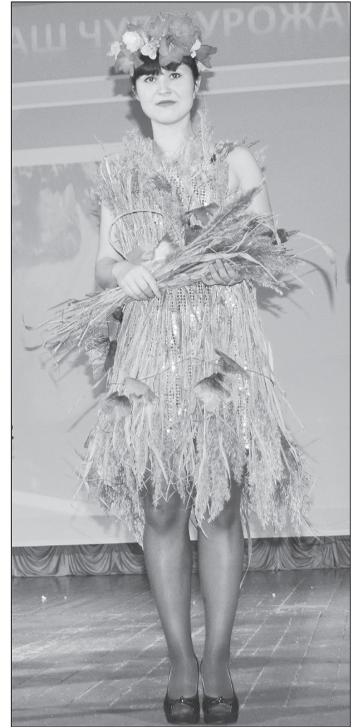
Кто бы мог подумать, что такую красоту можно получить из природного материала. Платье из колосьев злаковых просто супер!