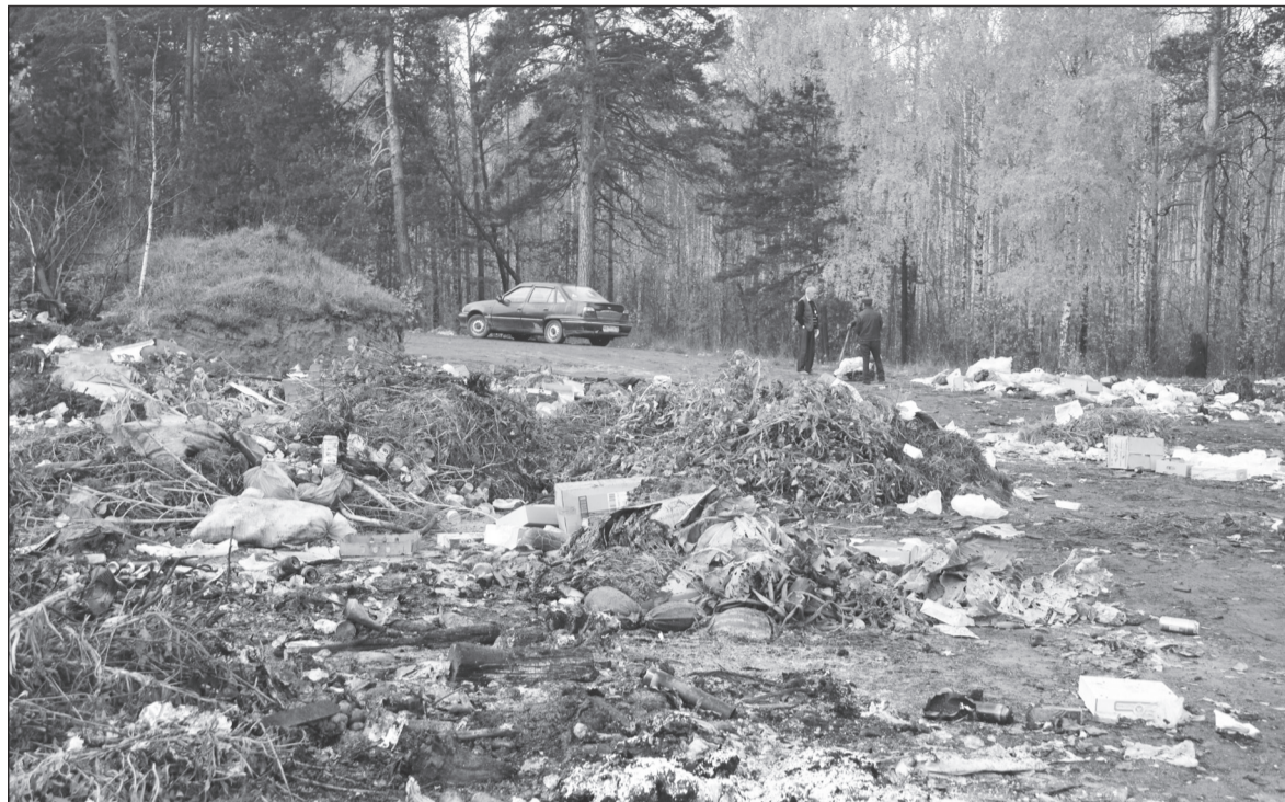
Полигон расчищен. А как туда попасть через завалы?

Кому-то, понятно, это покажется несправедливым, но уж как оно есть – сами пакостим, а потом жалуемся. Почему так обобщённо, да потому что такую