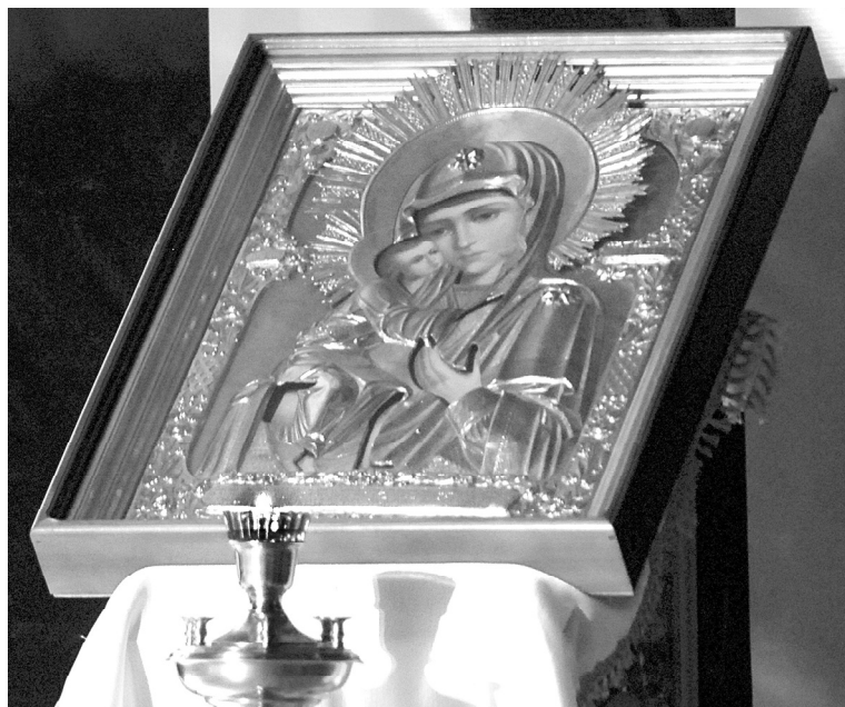
В память об усопших воинах

Воинам, за Веру и Отечество нашим, посвящается