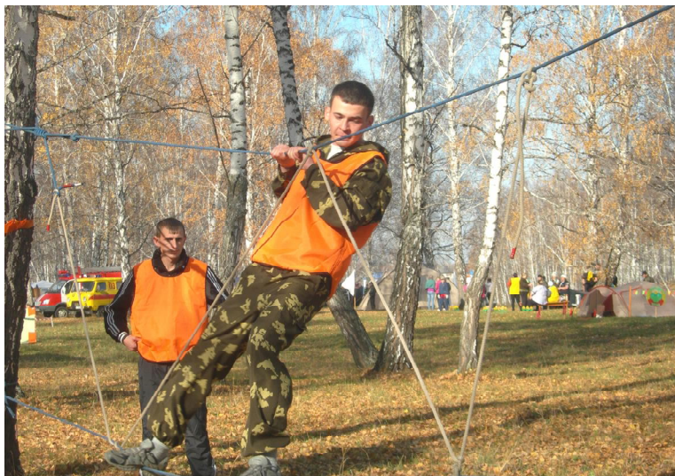
На «полосу выживания»