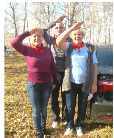
Специалисты администрации района всегда готовы!

От имени участников районного Дня здоровья хочется поблагодарить организаторов мероприятия: отдел культуры,