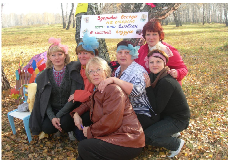
Команда детских садов - вместе мы сила