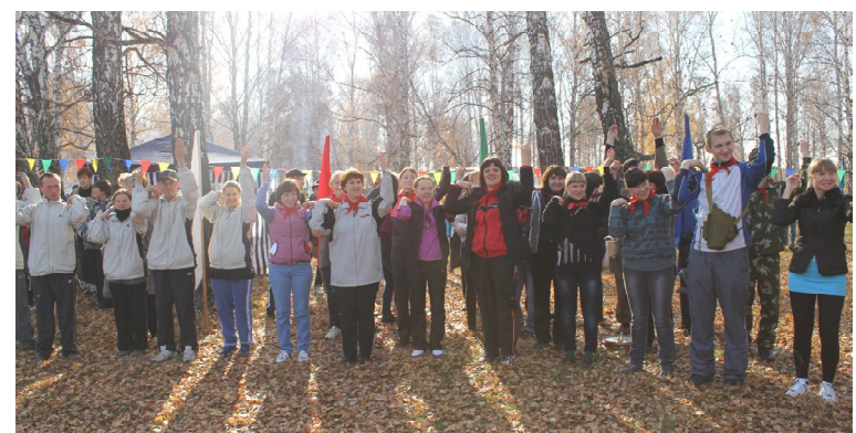
На разминку становись!