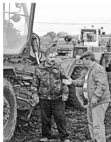
* Ставятся задачи

– К ферме сделаем гарантированный подъезд. Затем возле сельхозпомещений асфальтируем площадку в двести пятьдесят пять квадратных метров. Также вокруг здания будет проложена заасфальтированная дорога. Вместе с подъездом это примерно шестьсот метров, – говорит бригадир.