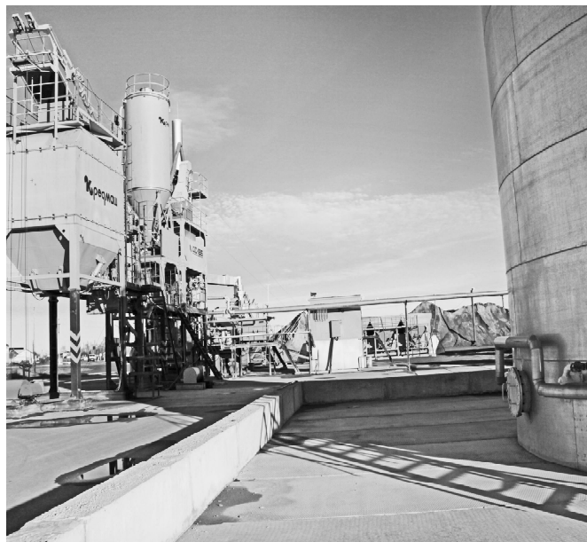
* На заводе