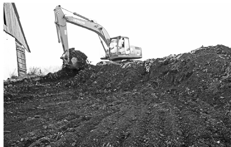
* Работа кипит

Дорожники планируют в течение трёх недель сдать объект. Площадка Большовской фермы будет благоустроена полностью.