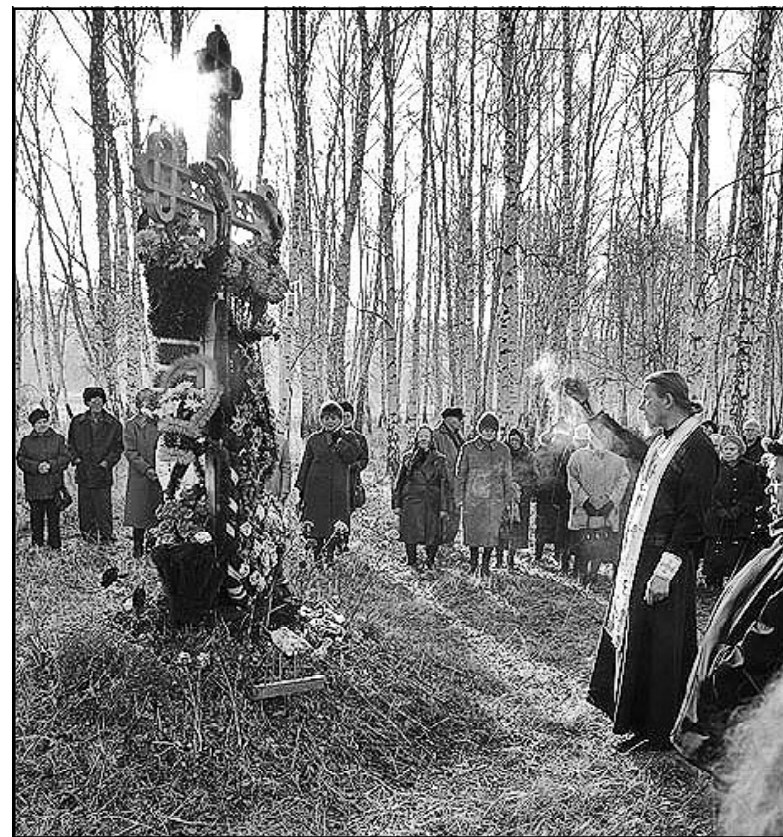
Понижида по невинно убиенным на месте расстрела – в местечке Борки под Ишимом

Вломились вечером, отец только пришёл с работы. Мать до конца своих дней всё пережива-