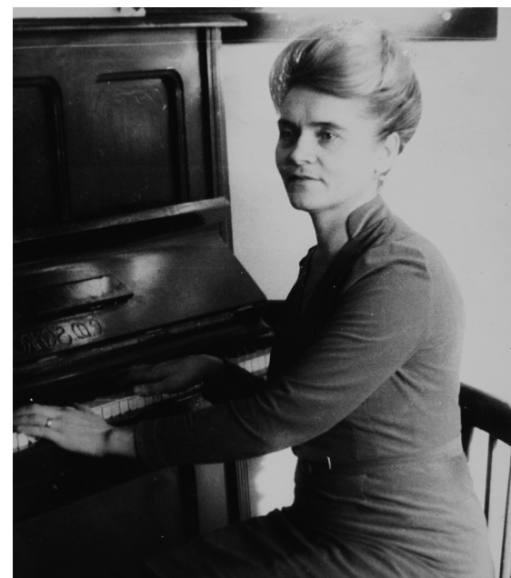
• У любимого инструмента.