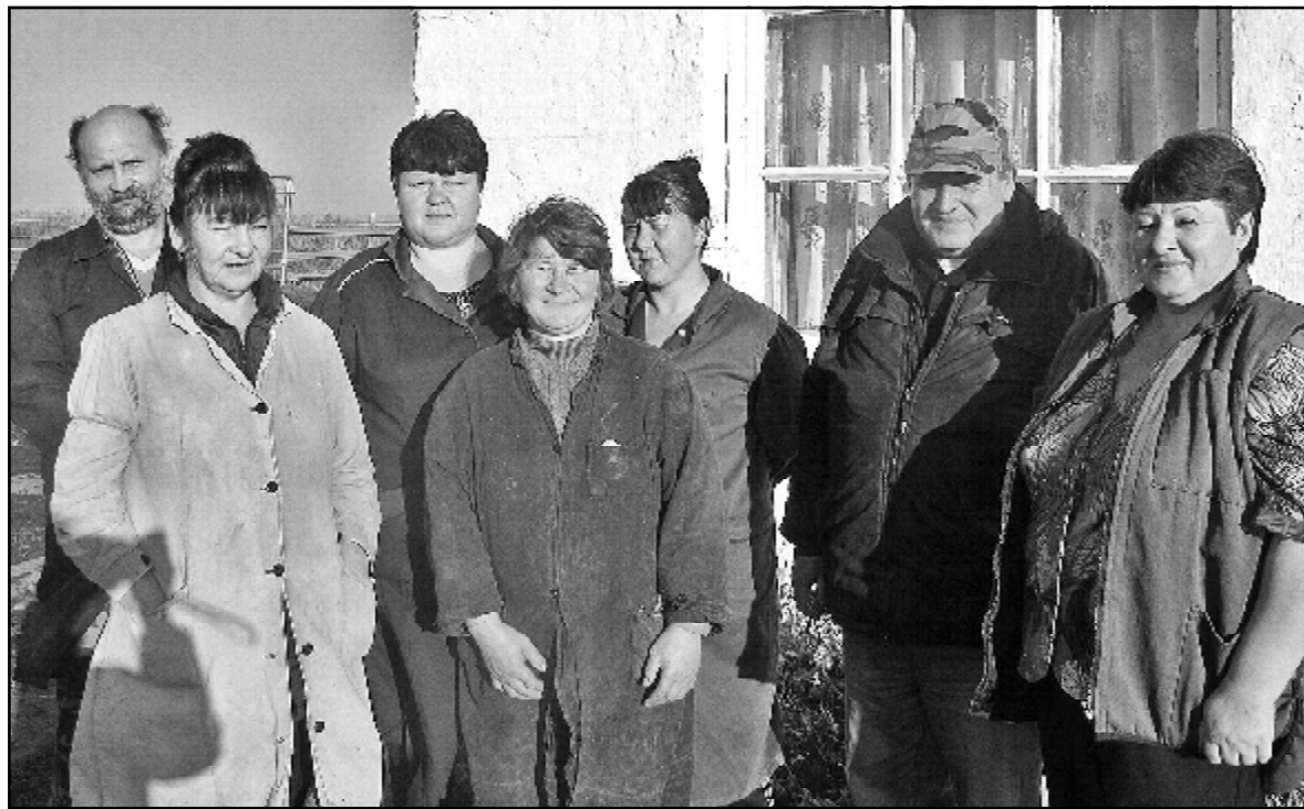
Работающий и дружный коллектив Шадринской МТФ