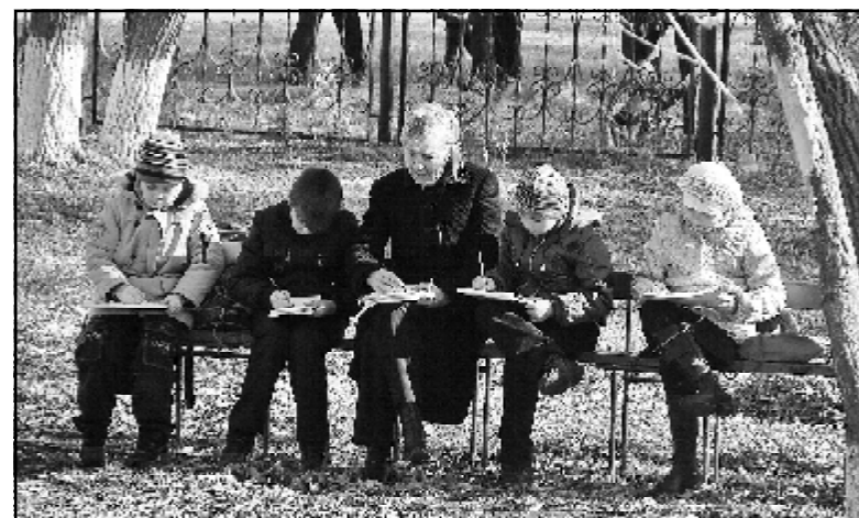
Учатся писать пейзажи с натуры