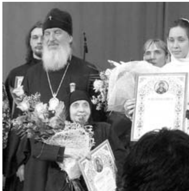
Владыка Дмитрий с дипломантами

Фестиваль – это добрая вежа в отростке духовного и культурного возрастания нашего молодого поколения.