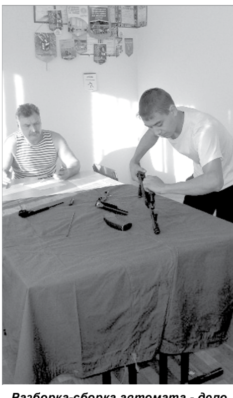
Разборка-сборка автомата - дело непростое