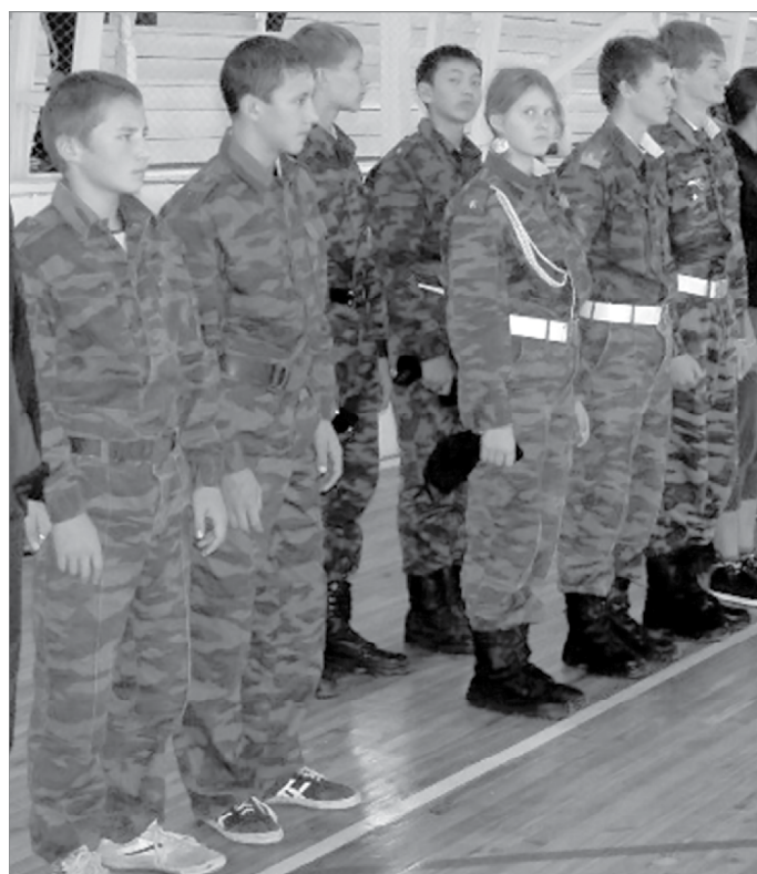
К военной службе ребята готовятся со школьной скамьи