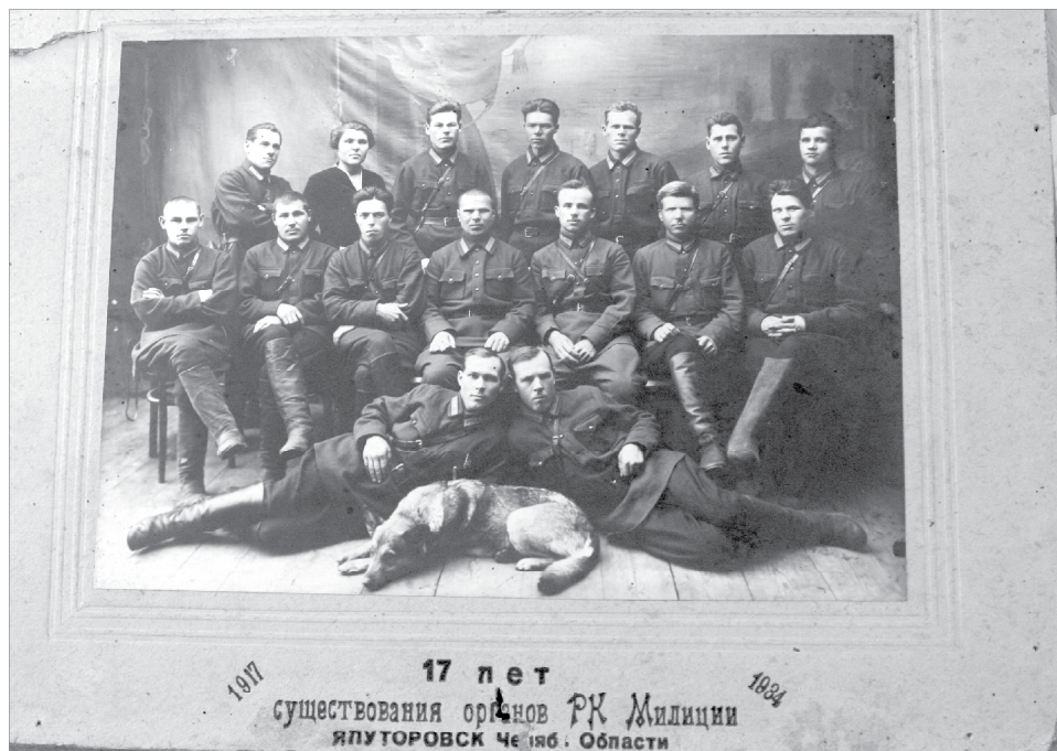
Свежее пополнение фондов.