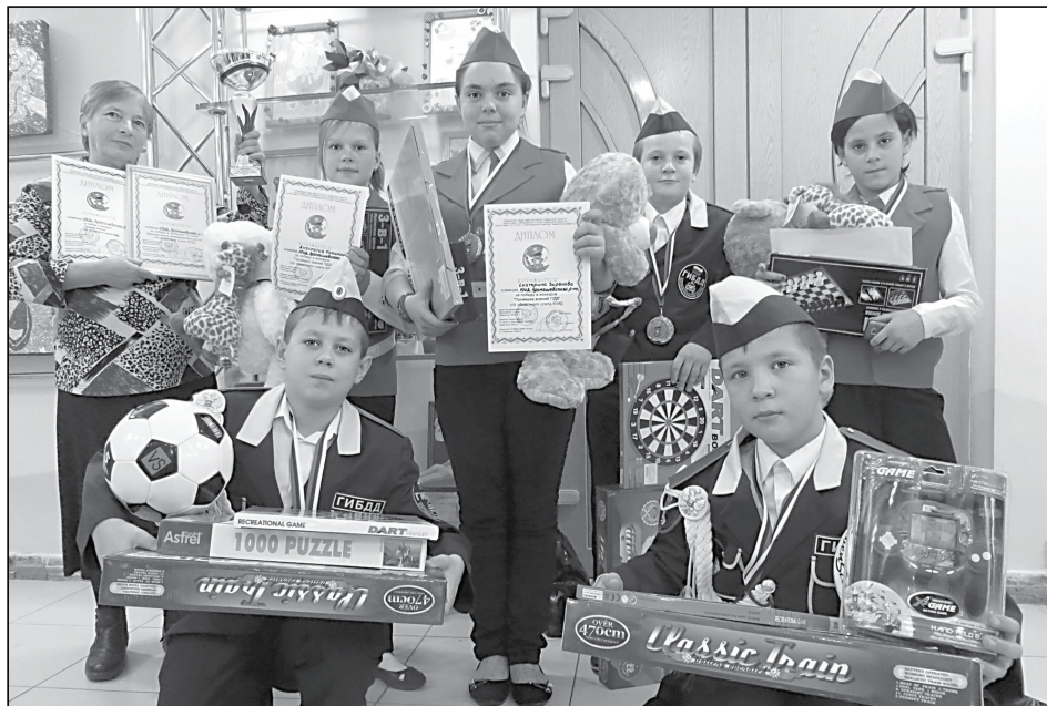
Участники слёта юных инспекторов движения.

В этом году победителей в общекомандном зачёте жюри не определяло. Но, сложив результаты по всем номинациям, мы подводим свой итог: ребята из Аромашевского района на сегодняшний день – это лучшая команда юных инспекторов движения в области. Они знают, как полезна и важна их работа, и очень хотят, чтобы все дети всегда были веселы, здоровы и счастливы.