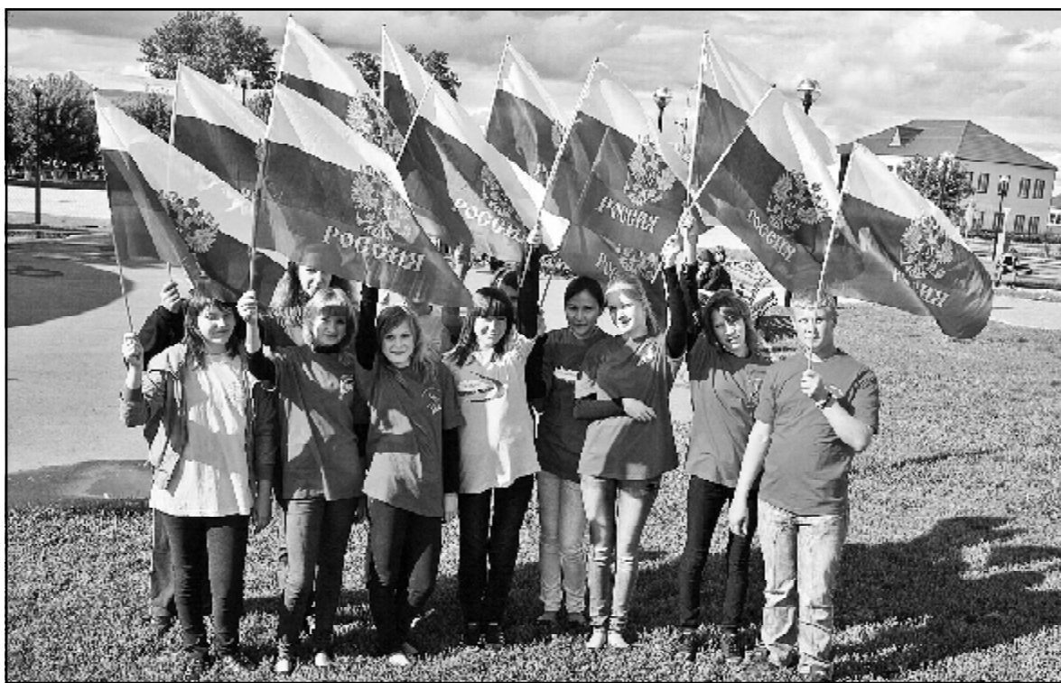
Ребята-волонтеры на празднике, посвящённом Дню России

Политсовет в своей работе не замыкался в рамках партийного