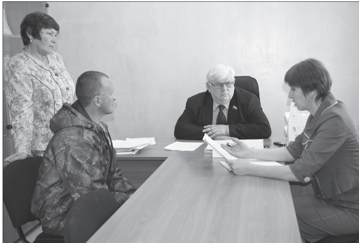
Вопрос об оформлении в собственность квартир, предоставленных взамен личных домов, снесённых при строительстве многоквартирника, не решается уже продолжительное время. Сумеет ли помочь депутат?