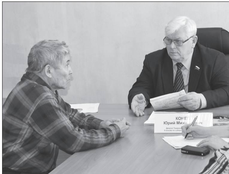
Ещё один квартирный вопрос, который просто необходимо решить.