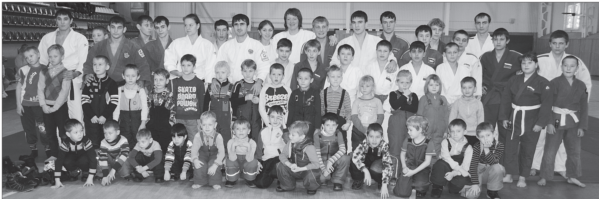
Снимок на память.