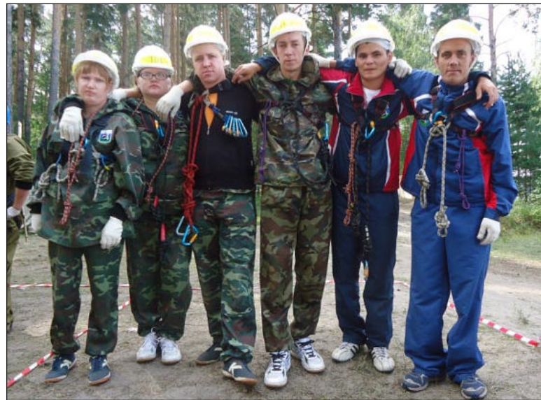
Команда районного отделения ВОИ на «Робинзоаде-2012».