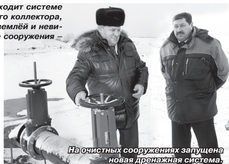
На очистных сооружениях запущена новая дренажная система.

На прошлой неделе состоялся пробный пуск новой дренажной