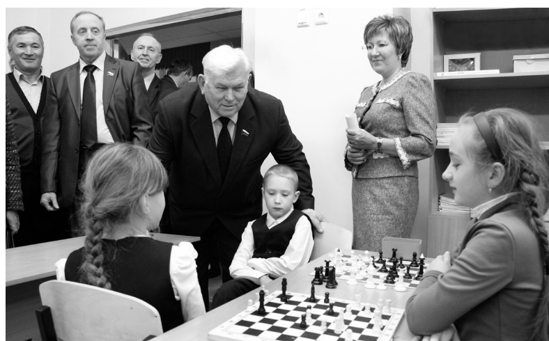
Организация детского досуга – забота общая и для ТОСов и для школ. В МАОУ СОШ № 12.

В Тюменской области территориальное общественное самоуправление в большей степени распространено на территориях городских округов (87 органов ТОС), а вот в сельских поселениях оно прижилось только в Сладковском (20 ТОСов!) и Тобольском (3 ТОСа) районах. Сегодня развитию этой формы местного самоуправления уделяется большое внимание как на уровне страны, так и в регионе, на местах. Однако препятствий на пути ещё хватает.