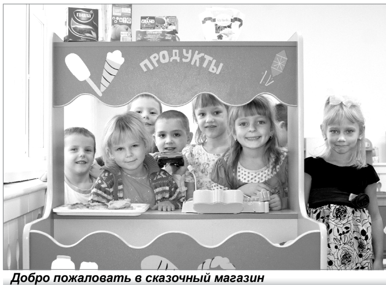
Добро пожаловать в сказочный магазин