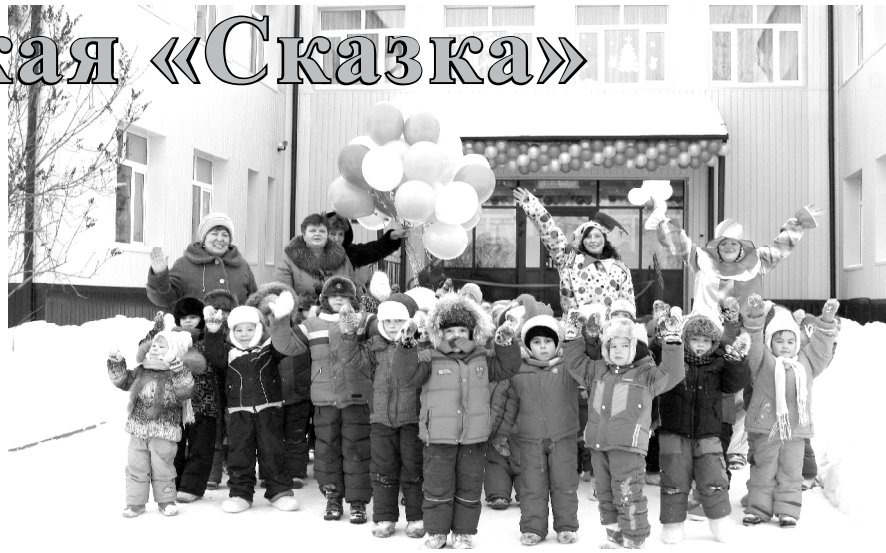
Обновленный детский сад уже принял воспитанников