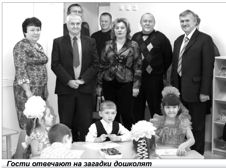
Гости отвечают на загадки дошколят