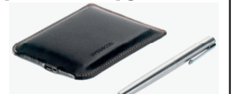
Внешний жёсткий диск Freecom USB 3.0, 500 Gb (натуральная кожа) – 3 450 руб.

Требуется технолог в цех розлива минеральной воды п.Школьный. Требование: спец. образование, знание компьютера, з/п сдельная. Тел.: 8 912 994 02 40 2-2