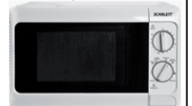
Микроволновая печь Scarlett – 2 290 руб.