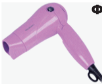
Фен Rolsen HD1016R Air Compact – 250 руб.