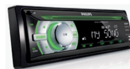
MP3 магнитола Philips – 2 190 руб.