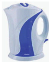
Чайник Polaris – 490 руб.

Открытие магазина бытовой и компьютерной техники «Техно+» 13 декабря. В честь открытия – неделя подарков! В ассортименте: телевизоры, DVD-плееры, музыкальные центры, домашние кинотеатры, чайники, утюги, микроволновые печи, пылесосы, автомагнитолы, автомобильная акустика, сабвуферы и многое другое. Мы рады видеть вас по адресу: с.Исетское, ул. Первомайская, 31А (в помещении магазина «ХайТек»)