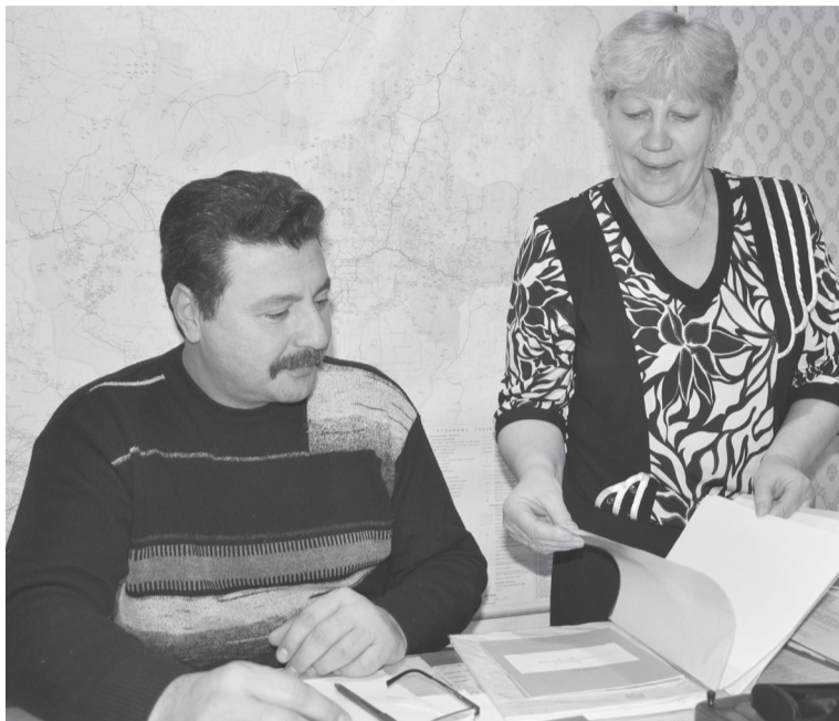
Рабочий день главы начинается с решения актуальных вопросов

здесь тоже есть особая категория граждан, которые нуждаются во внимании, зачастую и контроле.