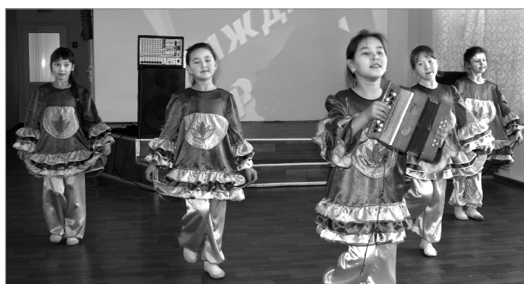
Выступает танцевальная группа «Веселинки» из Асланы

Педагоги уделяют особое внимание патриотическому воспитанию школьников. Ведь кому, как не взрослым учить детей быть достойными гражданами, любящими свою Родину, край, в котором родились и живут. Для этого специалисты районного отдела образования разработали проект «Я - гражданин России», посвященный нынче ещё и Году истории.