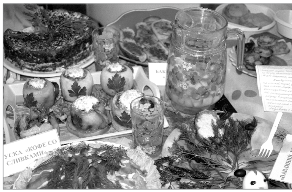
Приготовленные блюда выглядели очень аппетитно