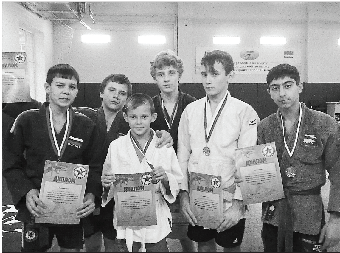
Призёры первенства спортивной школы «Олимпиец» по самбо.

11 и 12 декабря в городе Верхняя Пышма Свердловской области проводилось первенство Уральского Федерального округа по самбо среди молодёжи до 21 года, в котором принимали участие