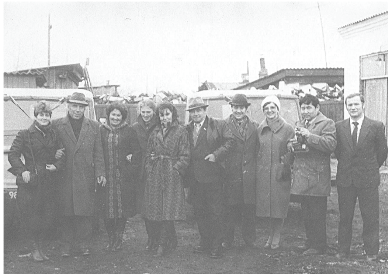
Несколько раз в году традиционно проводились «летучки» нескольких редакций. Коллеги Нижнетагдинского, Яркковского, Тюменского районов обменивались опытом, обсуждали злободневные вопросы, а потом, конечно же, выезжали на природу и культурно отдыхали. Мы с нетерпением ждали встреч, после которых хотелось ещё лучше работать, творить, они заряжали энергией, вызвали чувство ответственности и гордости за своё такое нужное всем дело... Канули в небытие эти летучки, а жаль...