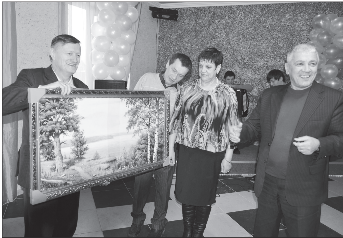
Что за новоселье без подарков, а на фоне такой природы и чашечка неспешно выпитого кофе нектаром покажется.

кой кофе в прекрасном зале, который привлекает своим дизайнерским решением: тёплые тона, небольшая эстрада, где планируется выступление музыкантов в живую, бар, стулья и столики, на которые прямо-таки хочется присесть.