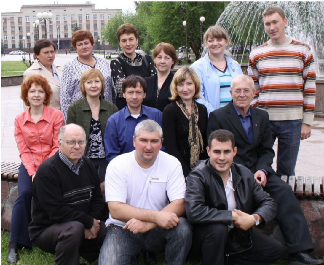
•Коллектив редакции, 2010 год.

В Москве 310 лет назад, 13 января 1703 года, вышла в свет первая русская газета «Ведомости о военных и иных делах, достойных знания и памяти, случившихся в Московском Государстве и во иных окрестных странах», положившая начало российской прессе.