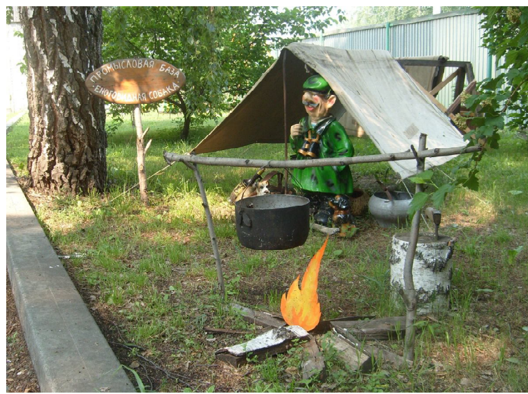
Сделано своими руками

Мы много поездили по стране, побывали в Европе, братских странах, с детьми в интересных круизах. Есть что вспомнить.