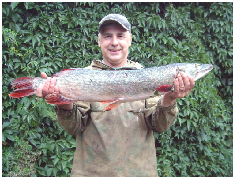
Сколько же килограммов весит эта щука?