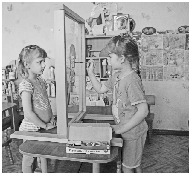
* Портрет на стеклянном мольберте