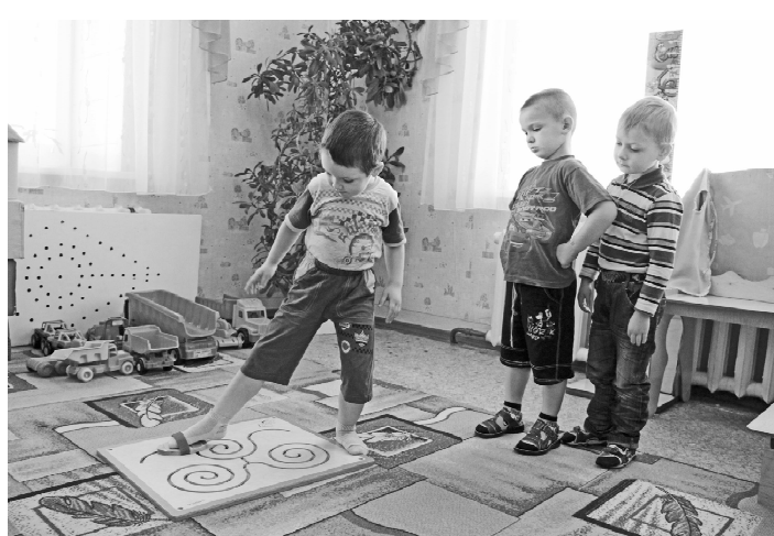
* «А я вот так умею!»

Кроме таких интеллектуальных игр есть в садике и живые уголки. Аквариумные рыбки, лягушки, комнатные растения. Дети с удовольствием ухаживают за всем этим. Развивается эстетический вкус, способность заботиться, ответственность. Ребятишки становятся добрее, терпеливее.