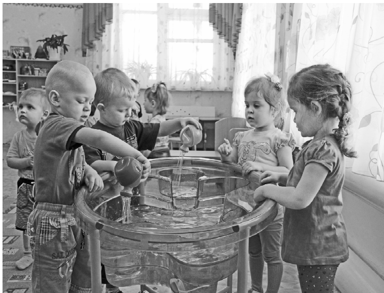
* Центр воды и песка