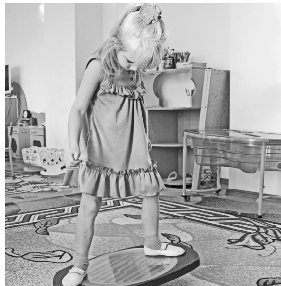
* «Равновесие удержу!»