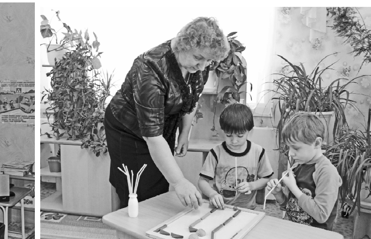
* «Учимся правильно дышать»

С закрытыми глазами они проводят пальчиками по этим изображениям, запоминают, а затем воспроизводят песком. Интересно, познавательно,