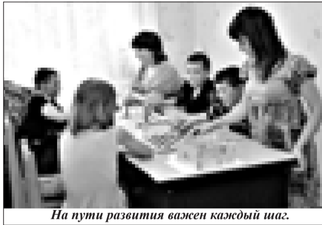
На пути развития важен каждый шаг.

Со второго квартала 2012 года организована работа