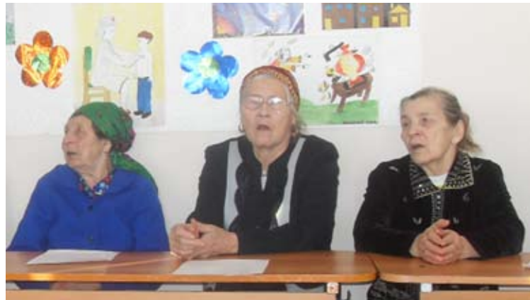
Песню «На Мамаевом кургане тишина...» исполняют гости урока мужества, д. Овсянникова

Минутой молчания почтили собравшиеся память всех, кто не