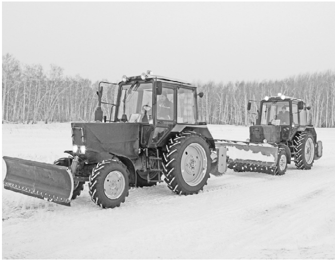
* Техника в деле