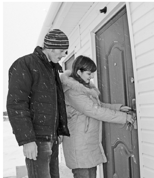
* Семья Мусихиных на крыльце своего дома