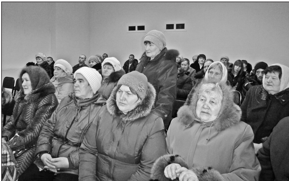
Песчановцы внимательно слушали всех выступавших и задавали волнующие их вопросы