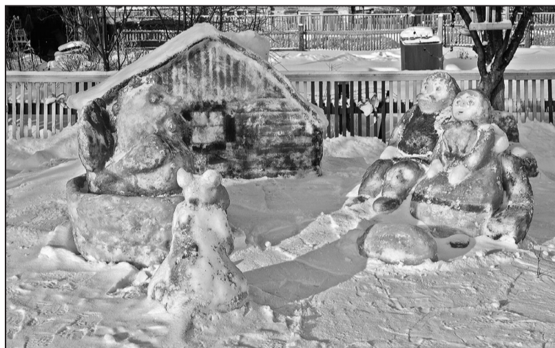
Дед да баба да Курочка Ряба в Казанском детсаду «Ёлочка»