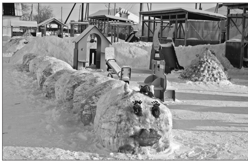
Симпатичная гусеница возле Новоселёзнёвского детсада «Колокольчик»