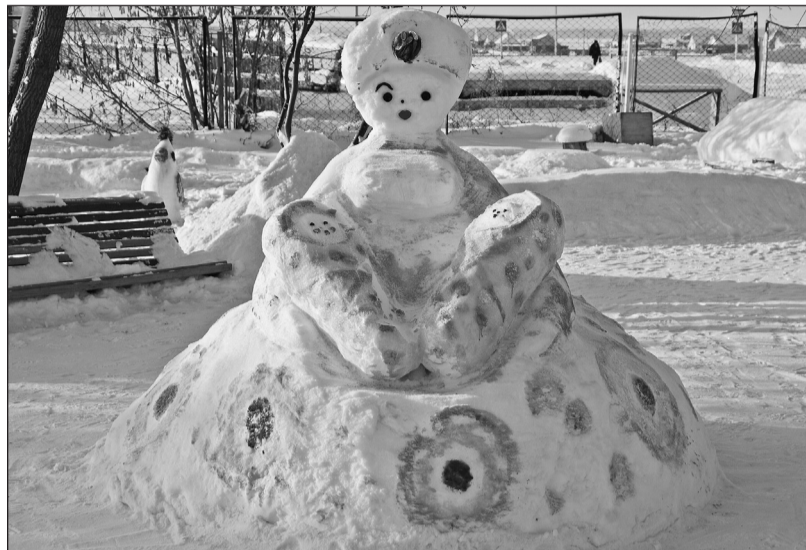
Снежная мама с двойняшками в Новоселёзнёвском детсаду «Ивушка»