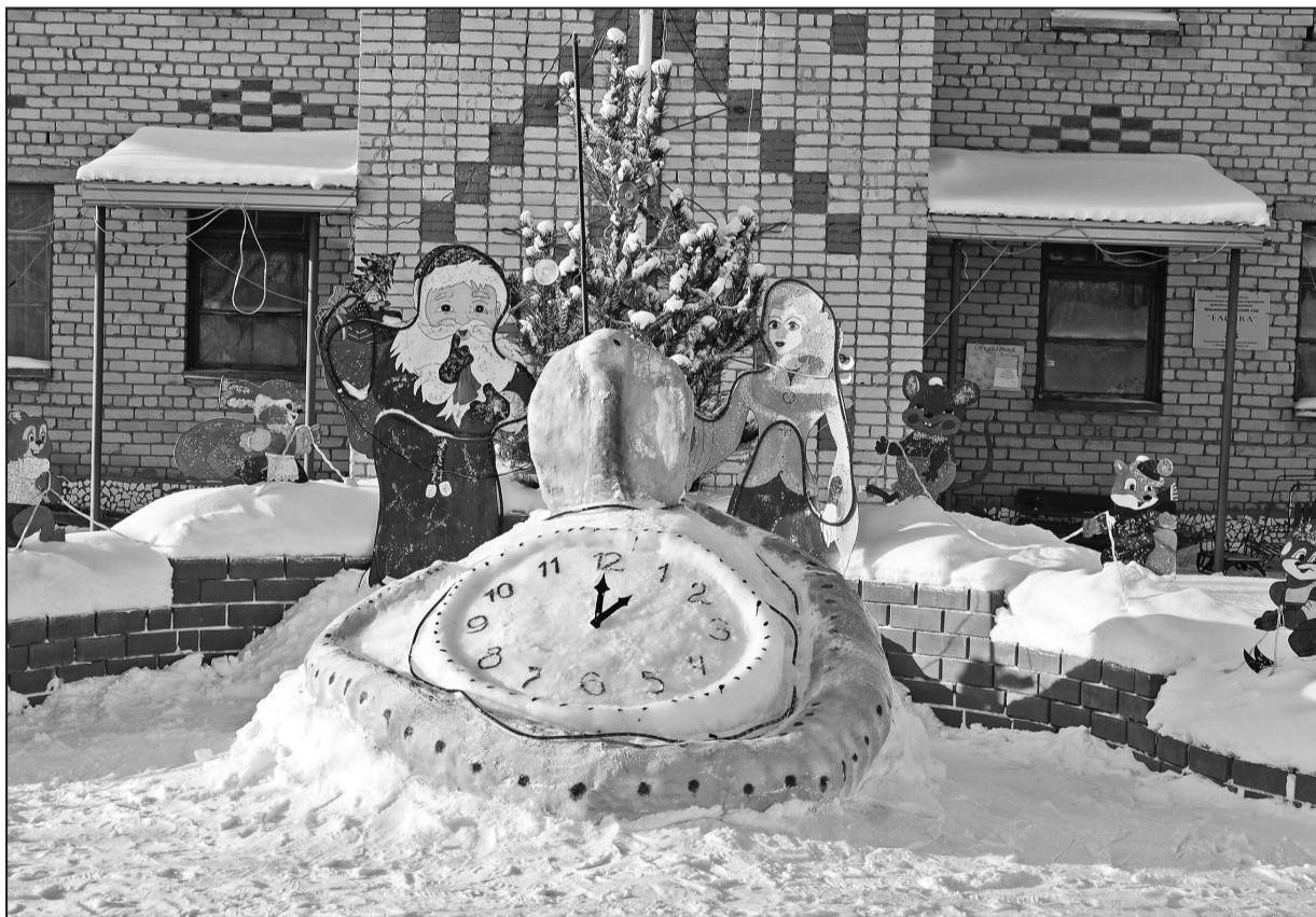
Новогодняя композиция возле Ильинского детского сада «Ёлочка»