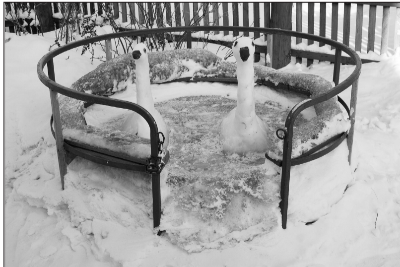
Беседка с лебедями в Казанском детсаду «Солнышко»