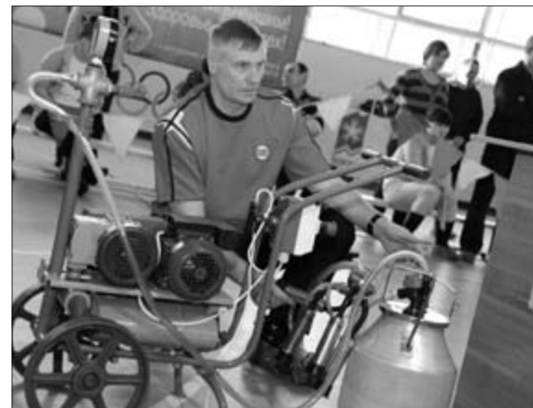
Практический этап соревнований джоров