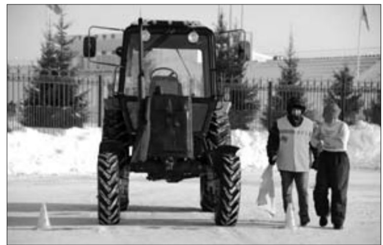
Соревнования трактористов. Команда Тобольского района на старте

Анна ЩЕРБИНИНА Дмитрий УЖЕНЦЕВ, Юрий ПОПОВ (фото)