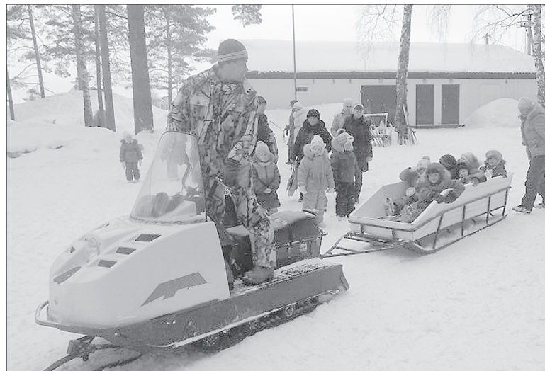
репетицией перед состязаниями по лыжным гонкам между детскими садами посёлка Винзили, которые планируется провести в марте.