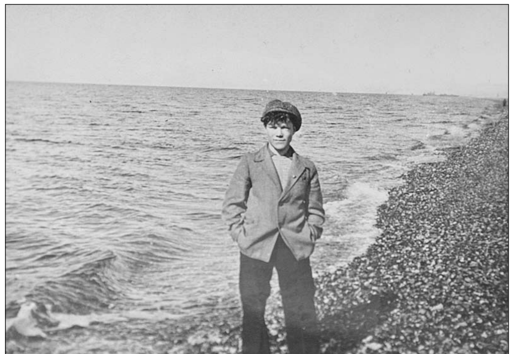
Может быть, тебе когда приснится край суровый, что Камчаткою зовут