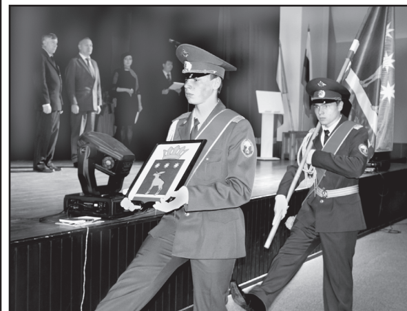
У района – новые флаг и герб