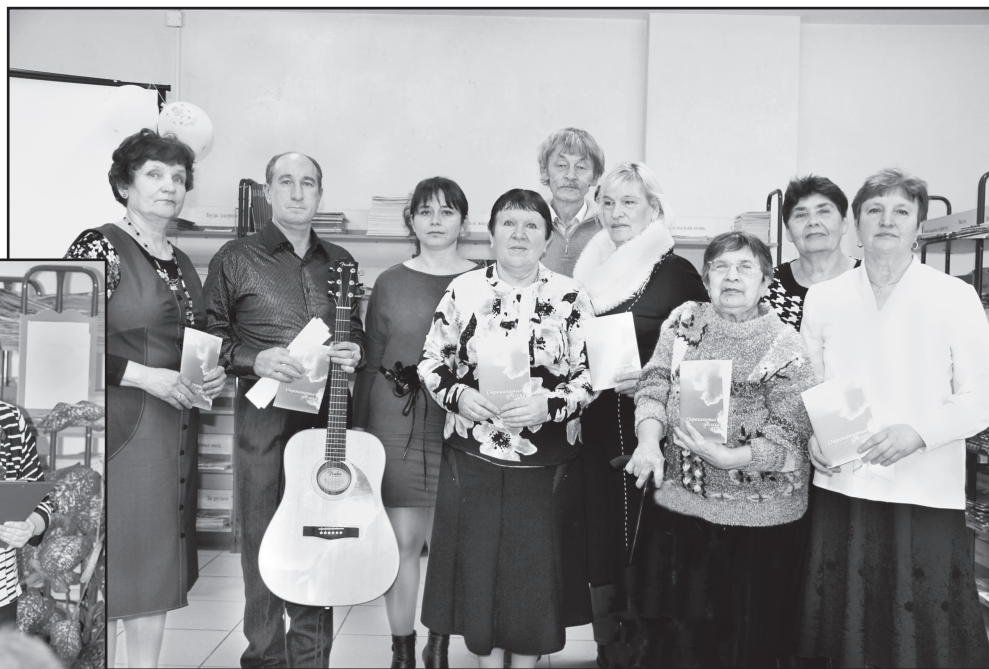
Поэты – участники конкурса