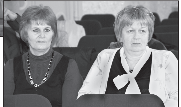
Открытое заседание думы Зоновского сельского поселения