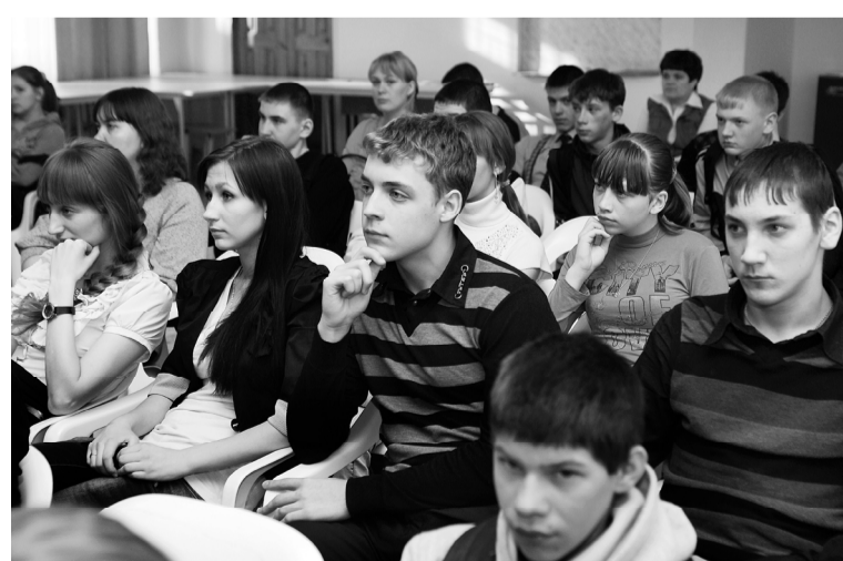
Учащиеся СОШ №1 во время встречи с мобильной бригадой