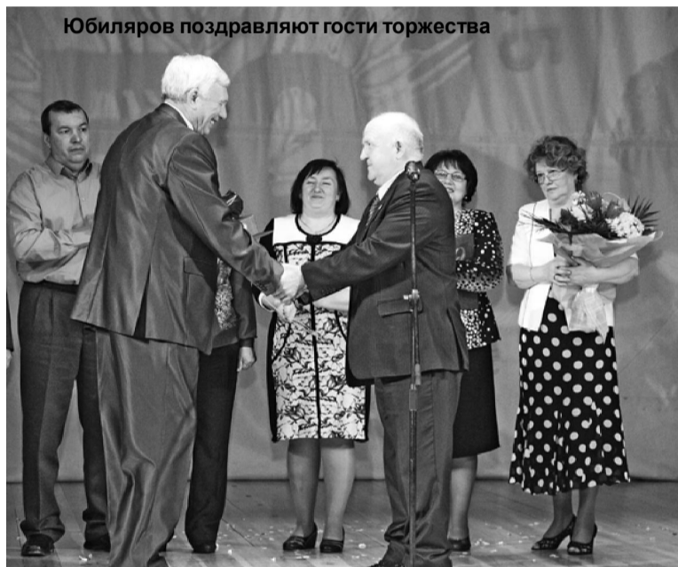
Юбиларов поздравляют гости торжества