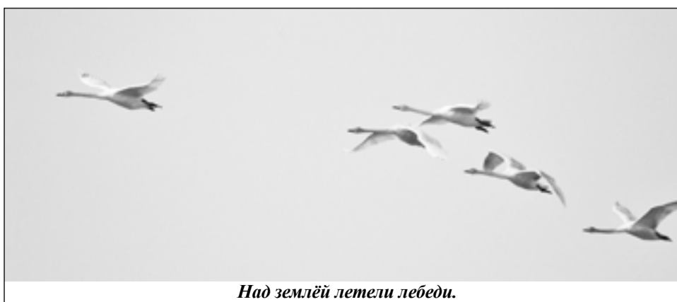
Над землёй летели лебеди.