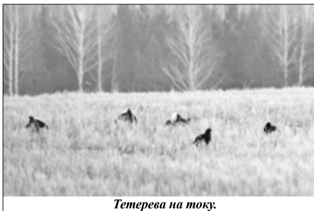
Тетерева на току.

Александр АНТИПИН, член Союза журналистов России.