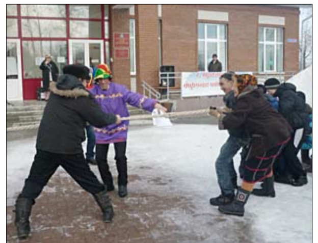
Байкаловцы меряются силушкой