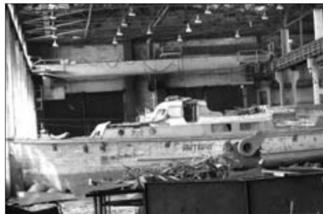
Судоверфи — хранилище старых кораблей