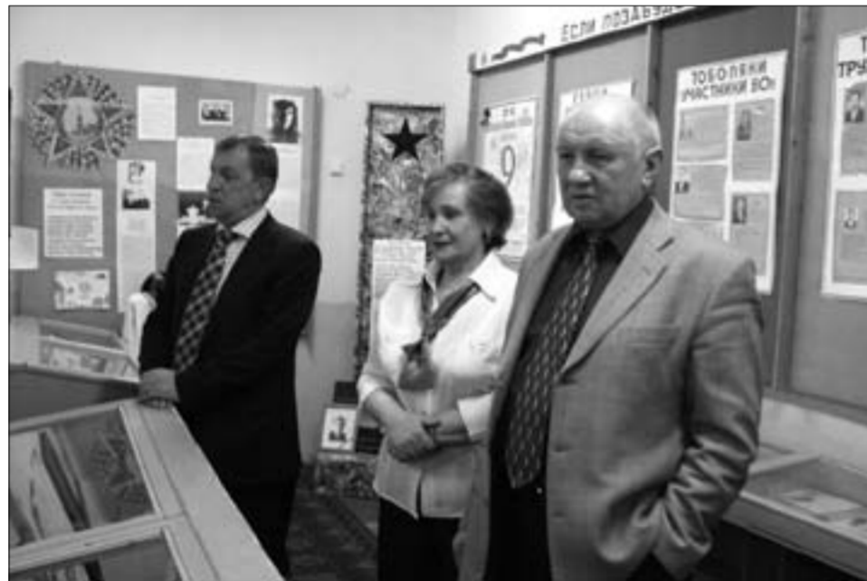
В музее школы