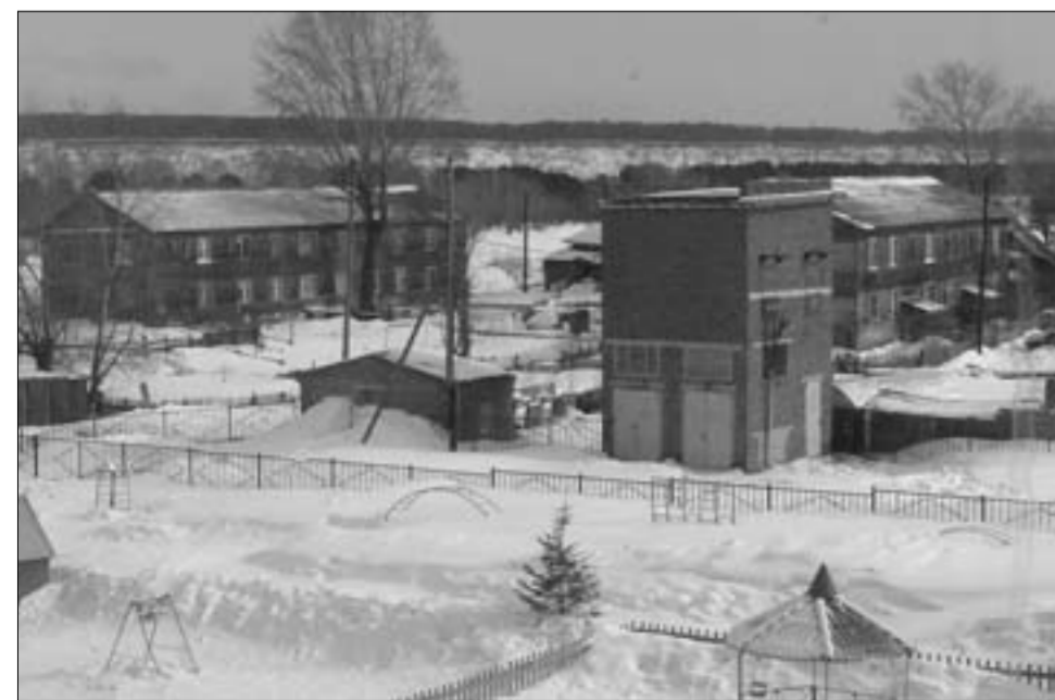
Савинский Затон. Вид из окна школы