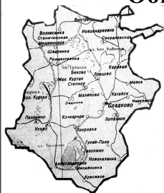
Основана в марте 1932 года

Общественно - политическая газета Сладковского района