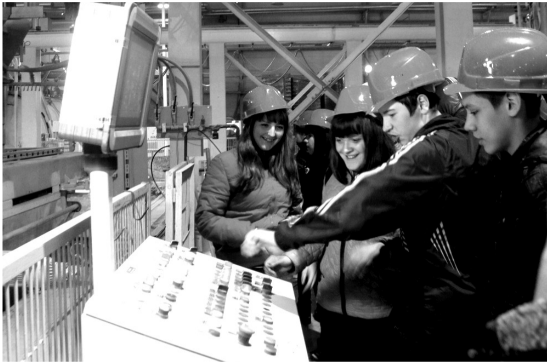
• Комсомольские школьники в цехе газобетонных изделий.

Завершается учебный год. У выпускников школ осталось совсем немного времени, чтобы определиться с выбором будущей профессии, а у выпускников вузов и ссузов – чтобы найти место работы согласно специальности, записанной в дипломе.