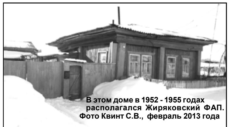
В этом доме в 1952 - 1955 годах располагался Жиряковский ФАП.

Одним из любопытных для нас архивным документом является « Протокол заседания президиума Жиряковского