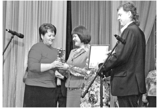
вита детей, ребята получили заслуженный диплом I степе-

По итогам фестиваля лучшим был признан хоровой коллектив центра дополнительного образования и раз-