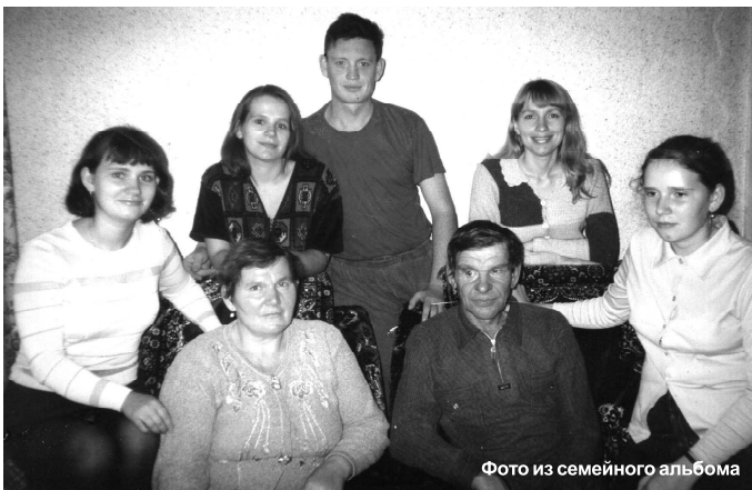
Фото из семейного альбома