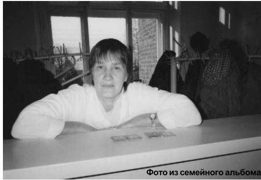
Фото из семейного альбома

В 1976 году после окончания Рябовской средней школы девушка поступила в училище в Тюмени и получила через 2 года диплом кондитера. Работать осталась в Тюмени на кондитерской фабрике, как и мечтала. А