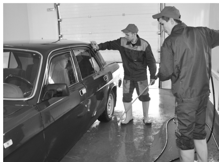
С открытием шиномонтажной мастерской ИП «Серкин» появилось три рабочих места