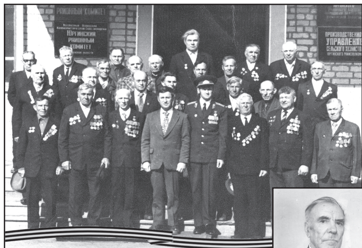
Фотография на память в День Победы

С первых дней войны рвался на фронт, но в тылу нужны были мужские руки. В 1943 году по мобилизации Уральского РВК попал на Брянский фронт. О боевом пути солдата рассказывают его награды – медали за освобождение Орла, Брянска, Подольска, Львова, Праги, Берлина и других городов. За личное мужество и