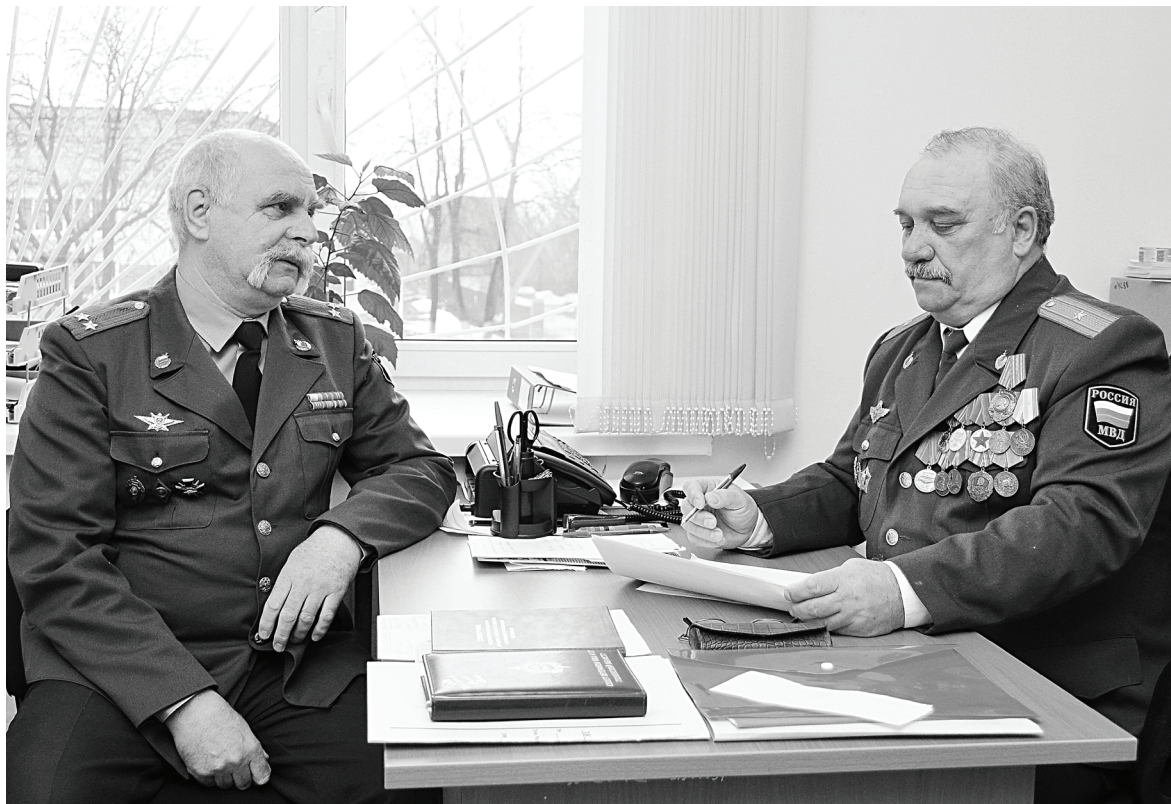
Есть о чём поговорить ветеранам.