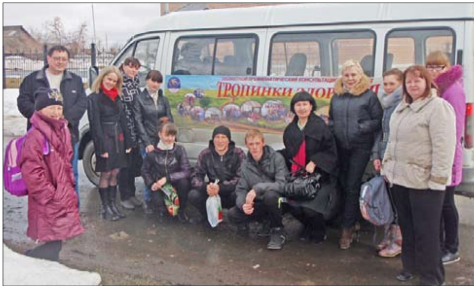
Участники акции «Тропинки здоровья»

Несколько лет в Тюменской области действует долгосрочная целевая антинаркотическая программа. Разработанный департаментом по спорту и молодёжной политике совместно с областным центром профилактики и реабилитации комплексный план мероприятий направлен на выработку у детей и подростков негативного отношения к наркотикам, пропаганду здорового образа жизни, формирование и утверждение социального позитива в молодёжной среде. Всё чаще профилактические программы успешно внедряются в учебных заведениях. Важным шагом стало создание передвижного консультативного пункта - профилактического авто-